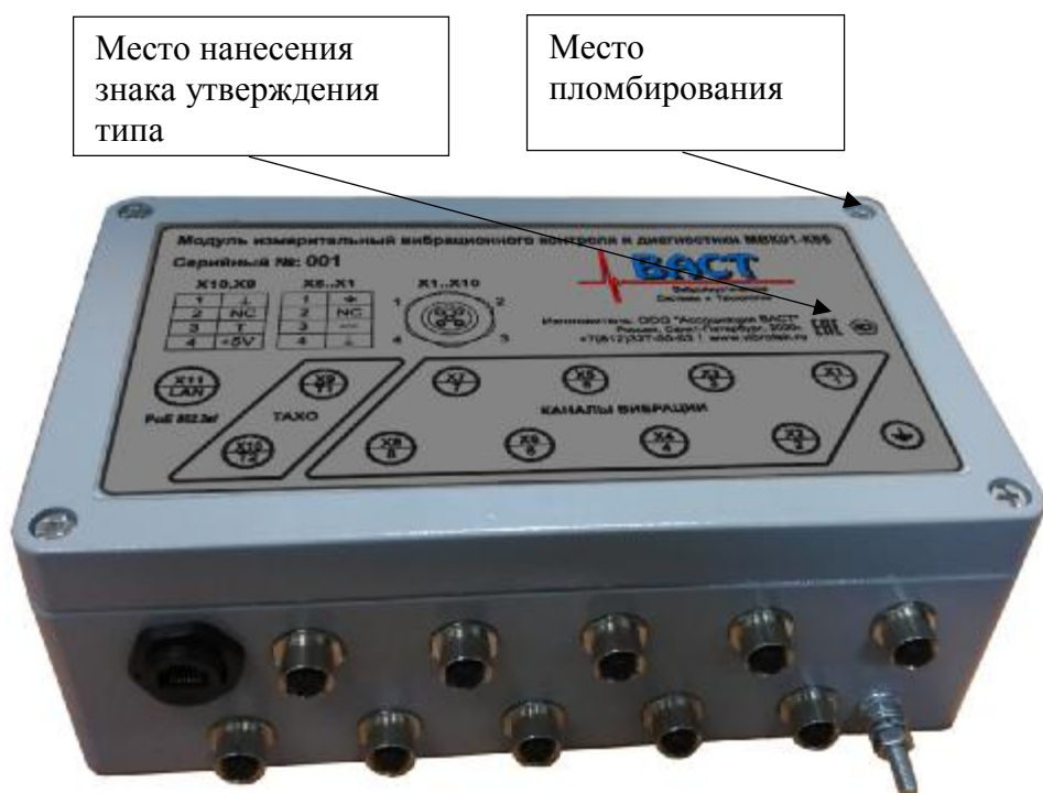
Рисунок 3 - Общий вид, место нанесения знака утверждения типа и место пломбирования от несанкционированного доступа модулей измерительных вибрационного контроля и диагностики MBK01-K65