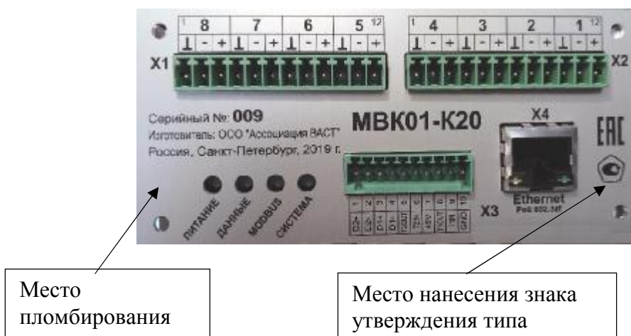
Рисунок 1 - Общий вид, место нанесения знака утверждения типа и место пломбирования от несанкционированного доступа модулей измерительных вибрационного контроля и диагностики MBK01-K20