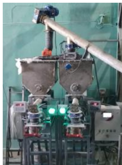
Рисунок 1 – Внешний вид ГПУ дозаторов «ДТР»