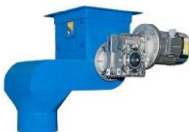
Рисунок 2 – Внешний вид ГПУ дозаторов «ДТР»