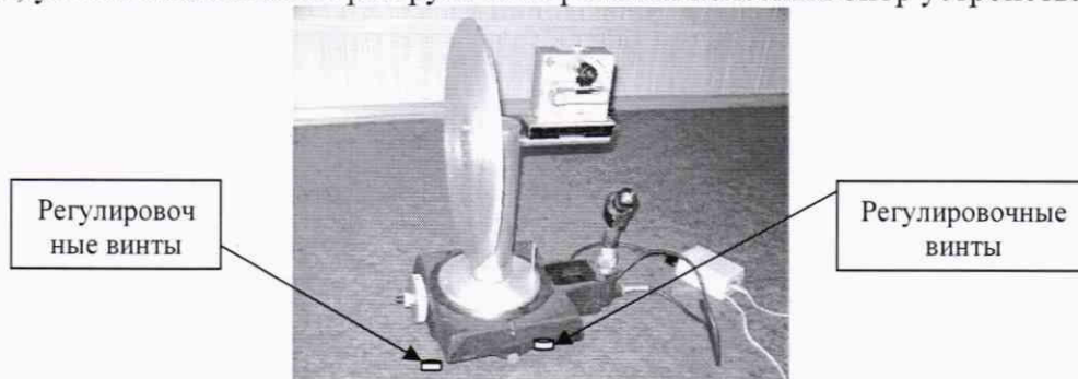
Рисунок 1 - Установка угломерная на основе столов поворотных СТ-9

7.4.1.1 Проверку диапазона измерений углов развала колес проводить с помощью квадранта оптического, путем последовательной попарной установки (соответственно на местах размещения передней и задней осей автомобиля) установок угломерных на основе столов поворотных СТ-9 (далее - установки угломерные). Установки угломерные (Рис. 1) размещаются на площадках, устанавливаемых на разгрузочных роликах колесных опор устройства.