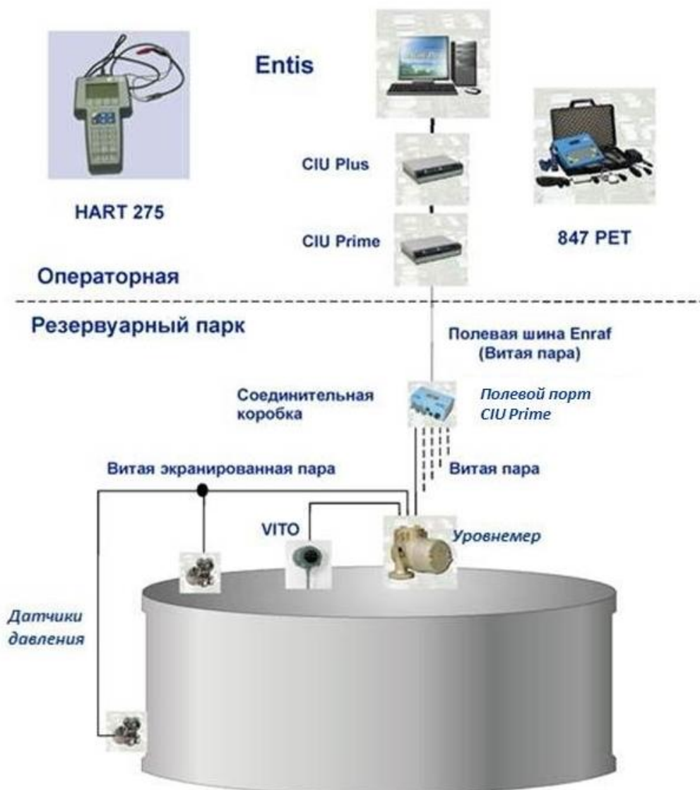
Рисунок 1 – Схема Система коммерческого учета и контроля резервуарных запасов парка комбинированной установки Entis- т.430-11

Общий вид устройств интерфейсов связи CIU 880 Prime/Plus представлен на рисунке 2.