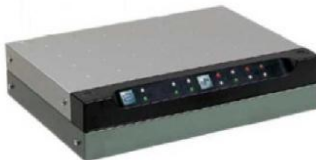
Рисунок 2 –Общий вид устройств интерфейсов связи CIU 880 Prime/Plus

Общий вид устройств интерфейсов связи CIU 880 Prime/Plus представлен на рисунке 2.