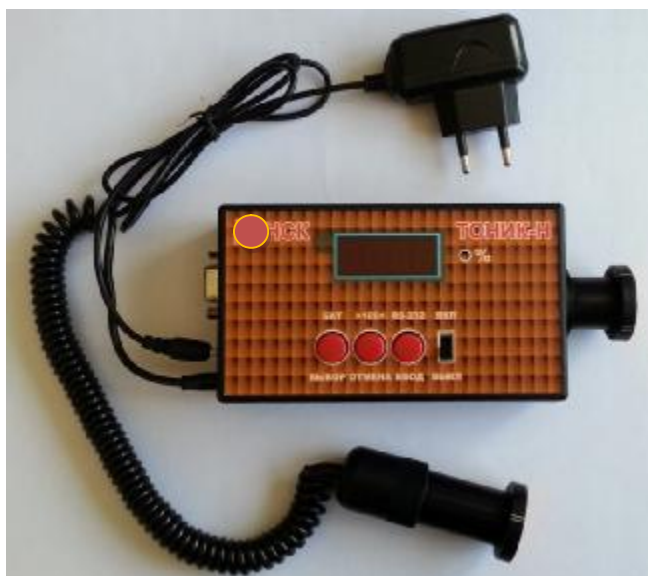
Рисунок 1 – Общий вид измерителей «ТОНИК-Н»