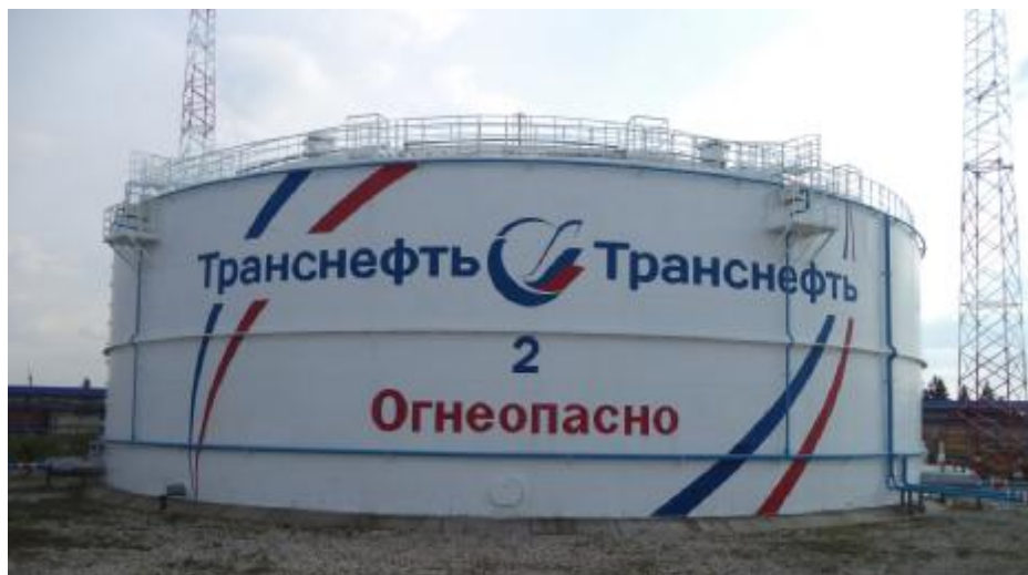
Рисунок 1 – Общий вид резервуара РВС-20000 зав.№ 2