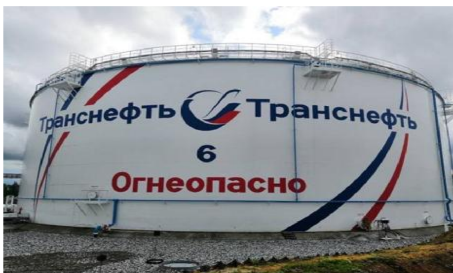
Рисунок 2 – Общий вид резервуара РВСП-50000 зав.№ 6