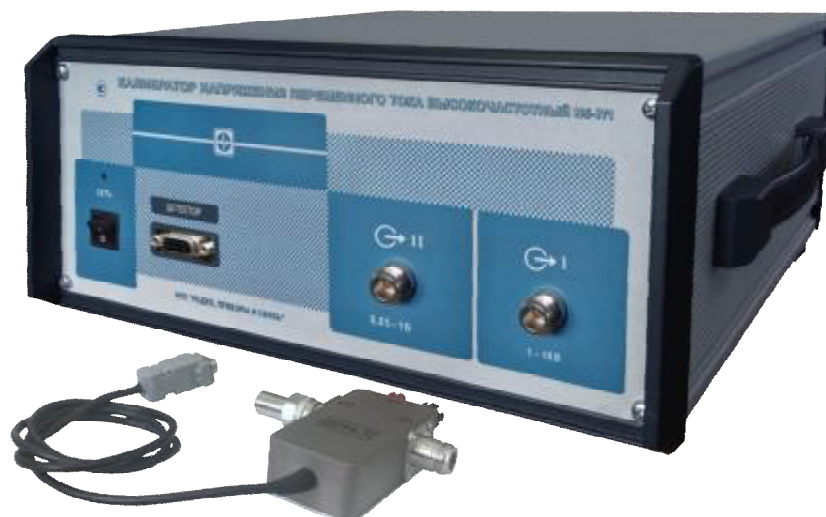
Рисунок 1 – Общий вид калибратора напряжения переменного тока Н5-7/1

Схема пломбировки от несанкционированного доступа, обозначение мест нанесения знака поверки представлены на рисунке 2.