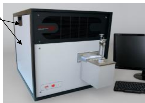
Спектрометры эмиссионные ИСКРОЛАЙН модификаций 250, 250К