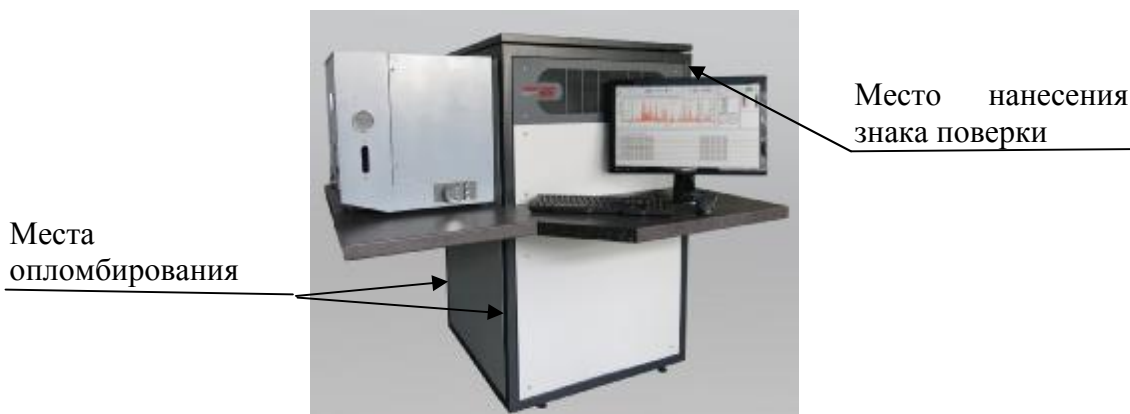
Спектрометры эмиссионные ИСКРОЛАЙН модификаций 1000, 1000М Рисунок 1 – Общий вид спектрометров эмиссионных ИСКРОЛАЙН