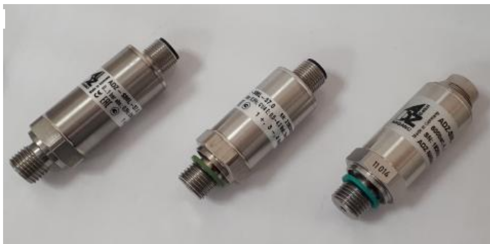
Рисунок 1 – Общий вид датчиков ADZ-SML

Пломбирование датчиков не предусмотрено.