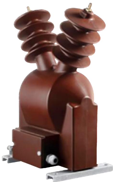
Рисунок 4 – Общий вид трансформаторов напряжения VZF 24, GZF 24 с креплением на установочной раме