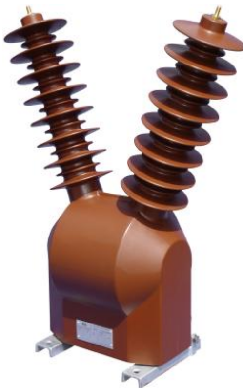
Рисунок 6 – Общий вид трансформаторов напряжения VZF 36, GZF 40,5 с креплением на установочной раме