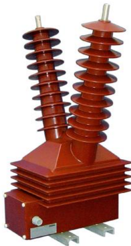
Рисунок 5 – Общий вид трансформаторов напряжения GZF 30 с креплением на установочной раме