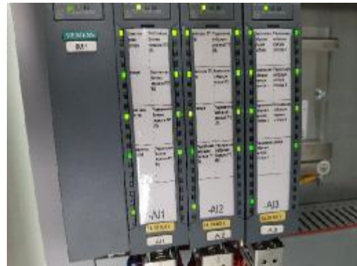
Рисунок 2 - Общий вид модулей ввода-вывода 6ES7531-7NF10