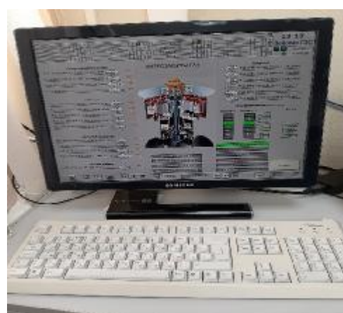
Рисунок 4 - Общий вид аппаратуры и оборудования среднего и верхнего уровней (АРМ)