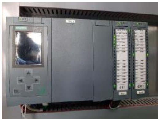
Рисунок 1 - Общий вид контроллеров программируемых SIMATIC S7-1500

На рисунке 5 приведена структурная схема СИУ ВЗ.