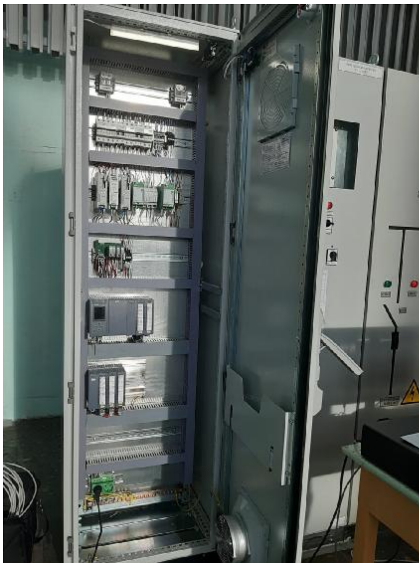
Рисунок 3 - Общий вид шкафа ПТК компонентов СИУ В3 Аппаратура и оборудование среднего уровня