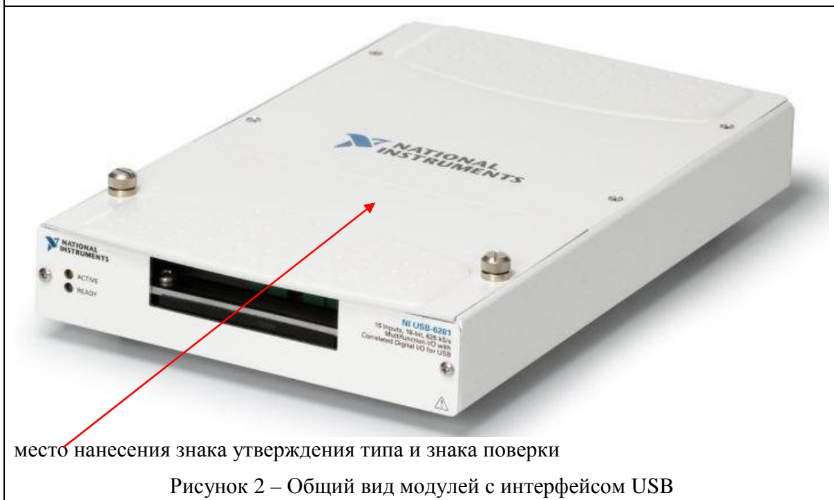
место нанесения знака утверждения типа и знака поверки