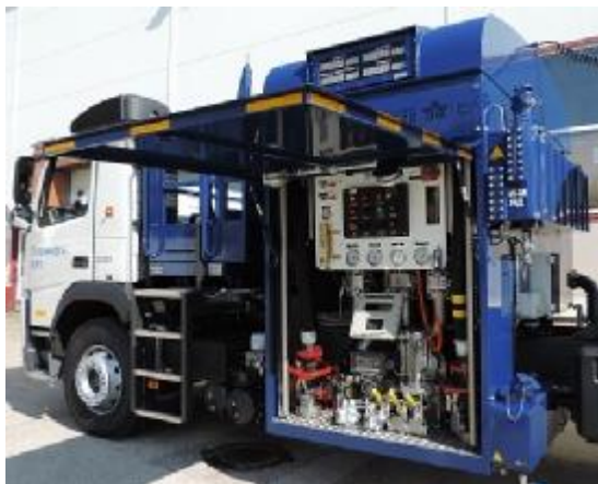
Рисунок 1 – Общий вид системы спереди на средстве заправки