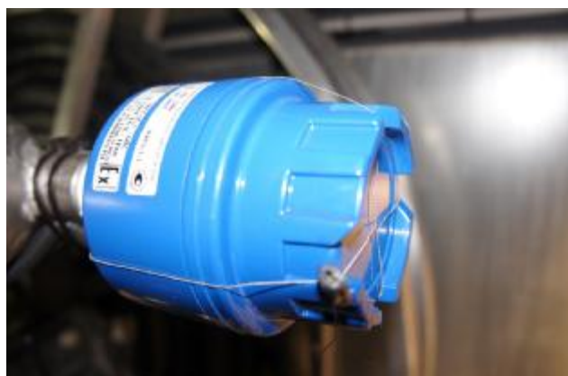
Рисунок 10 – Пломбирование датчика температуры