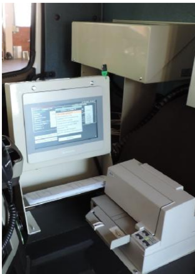
Рисунок 3 – Общий вид составных частей системы (БСК-01 с закрытой защитной крышкой, ТОС-01, принтер) в кабине средства заправки