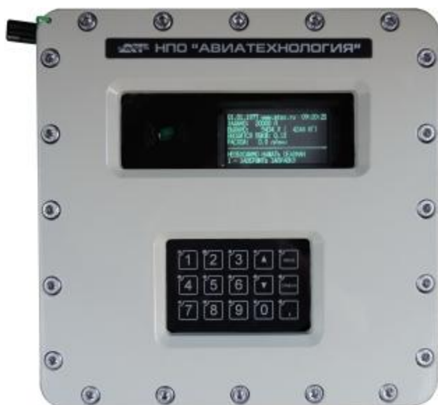
Рисунок 6 – Пульт управления специальным контроллером (ПУСК-01)