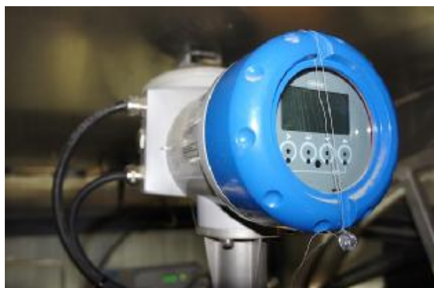
Рисунок 9 – Пломбирование расходомера-счетчика массового