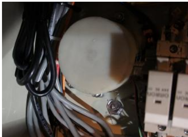
Рисунок 11 – Пломбирование преобразователя температуры PR