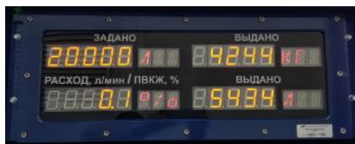
Рисунок 7 – Табло информационное (ТИ-01)

Места нанесения клейм (наклеек и пломб) на составные части системы изображены на рисунках 8 – 11.