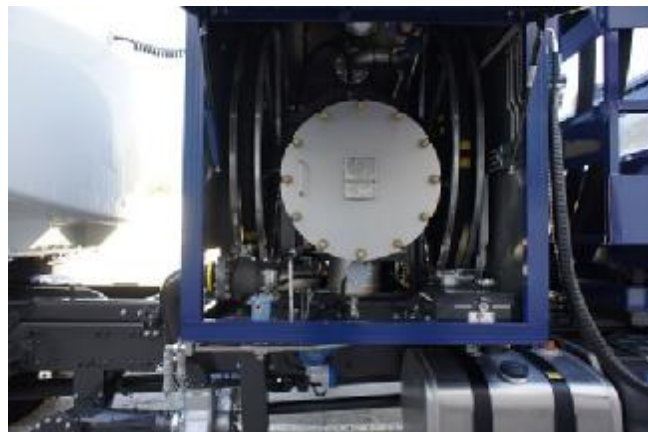
Рисунок 2 – Общий вид системы сзади на средстве заправки