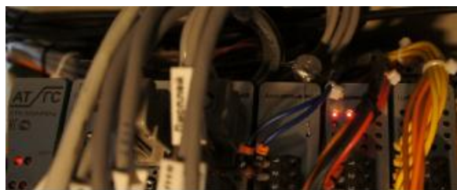
Рисунок 8 – Пломбирование платы аналогового входа контроллера