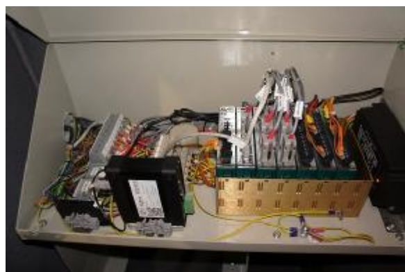
Рисунок 4 – БСК-01 без защитной крышки