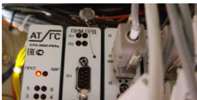
Рисунок 7 – Пломбирование платы центрального процессора контроллера

Места нанесения клейм (наклеек и пломб) на составные части системы изображены на рисунках 8 – 11.