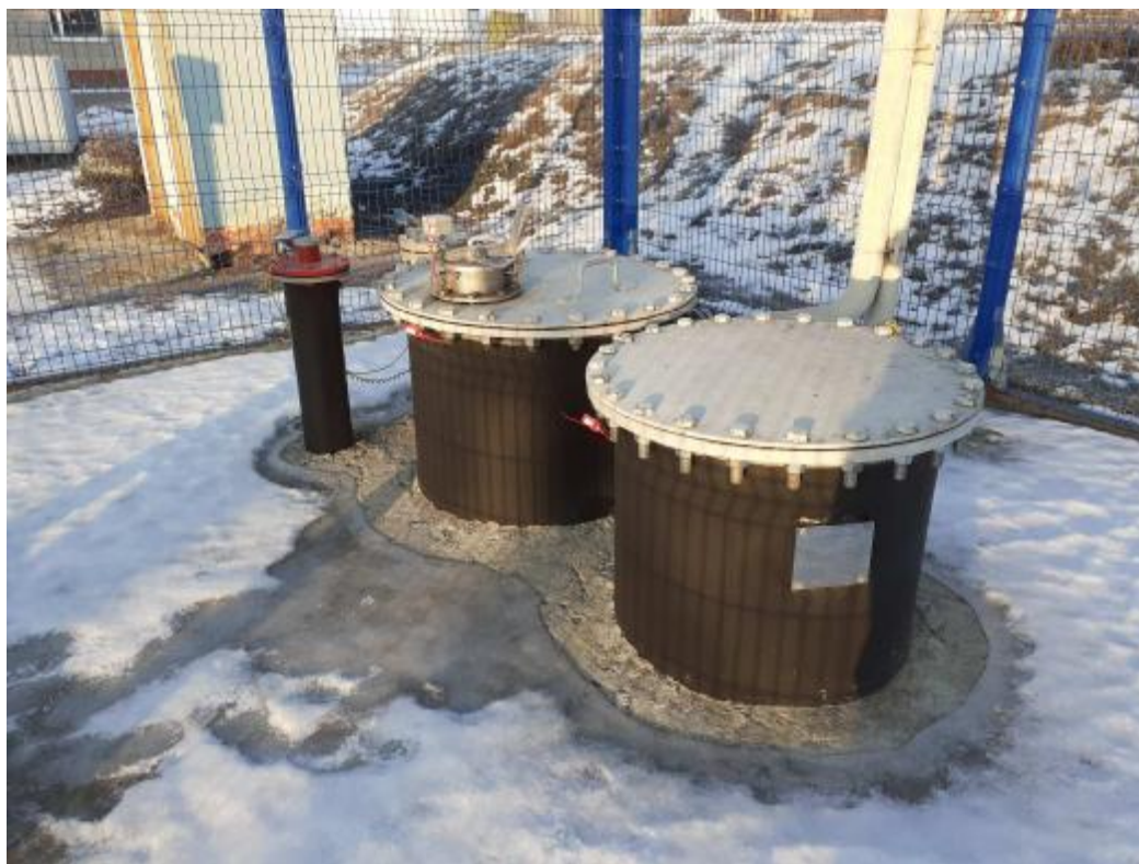
Рисунок 1 – Общий вид места установки резервуара РГС-8 с заводским номером 1

Общий вид места установки и эскиз резервуара стального горизонтального цилиндрического РГС-8 представлен на рисунках 1 и 2.