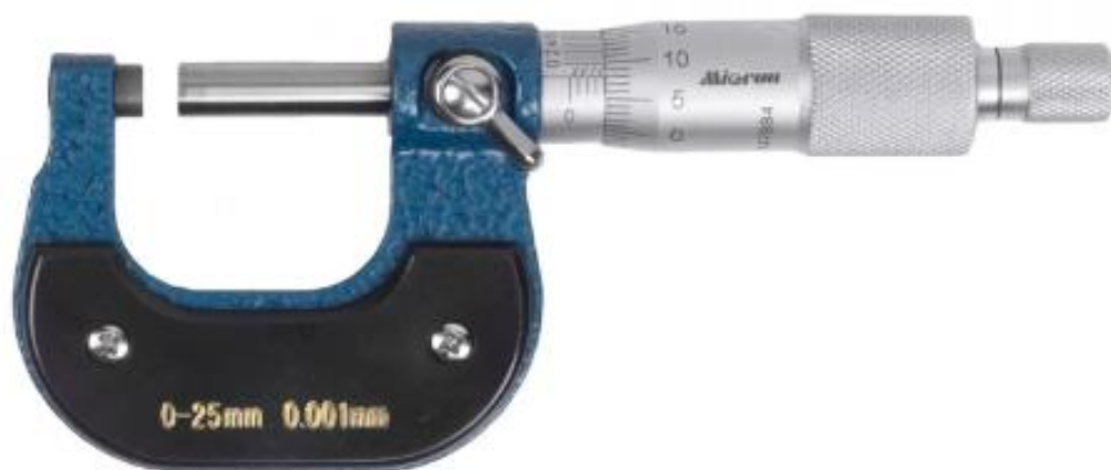
Рисунок 3 – Общий вид исполнения микрометров модели МК