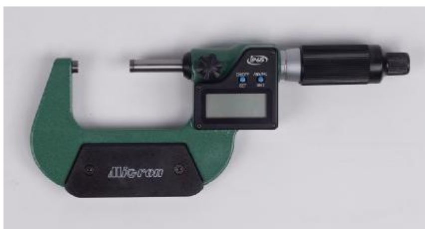
Рисунок 10 – Общий вид исполнения микрометров модели МКЦ