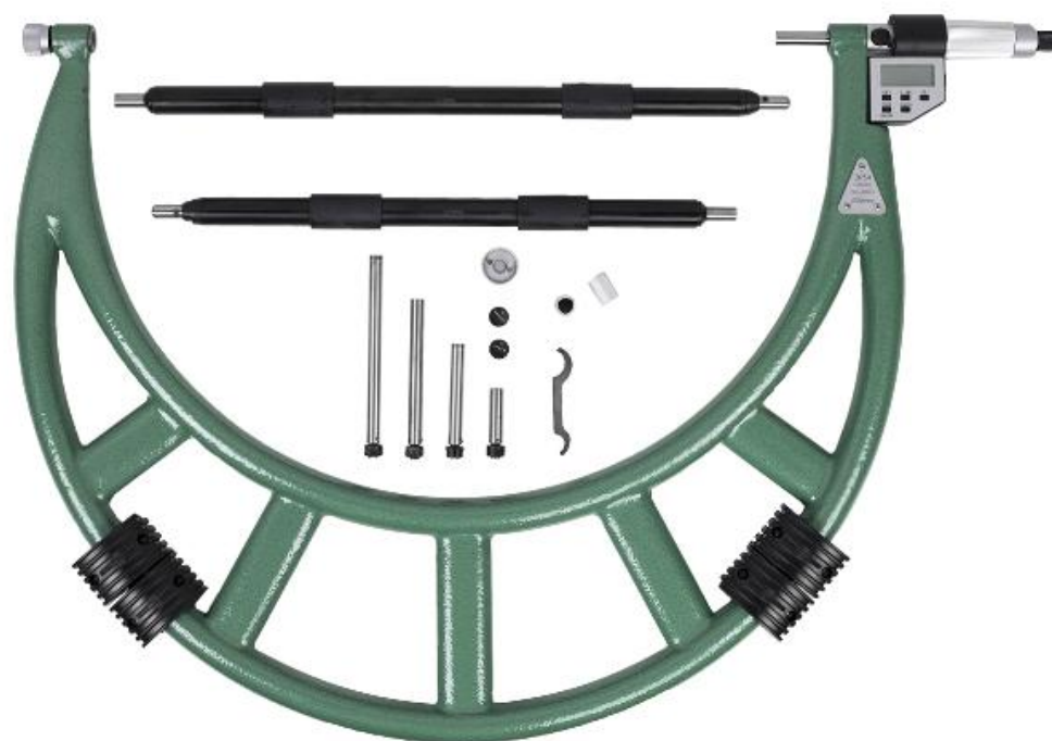
Рисунок 13 – Общий вид исполнения микрометров модели МКЦ