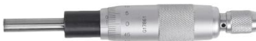
Рисунок 15 – Общий вид исполнения микрометров модели МГ