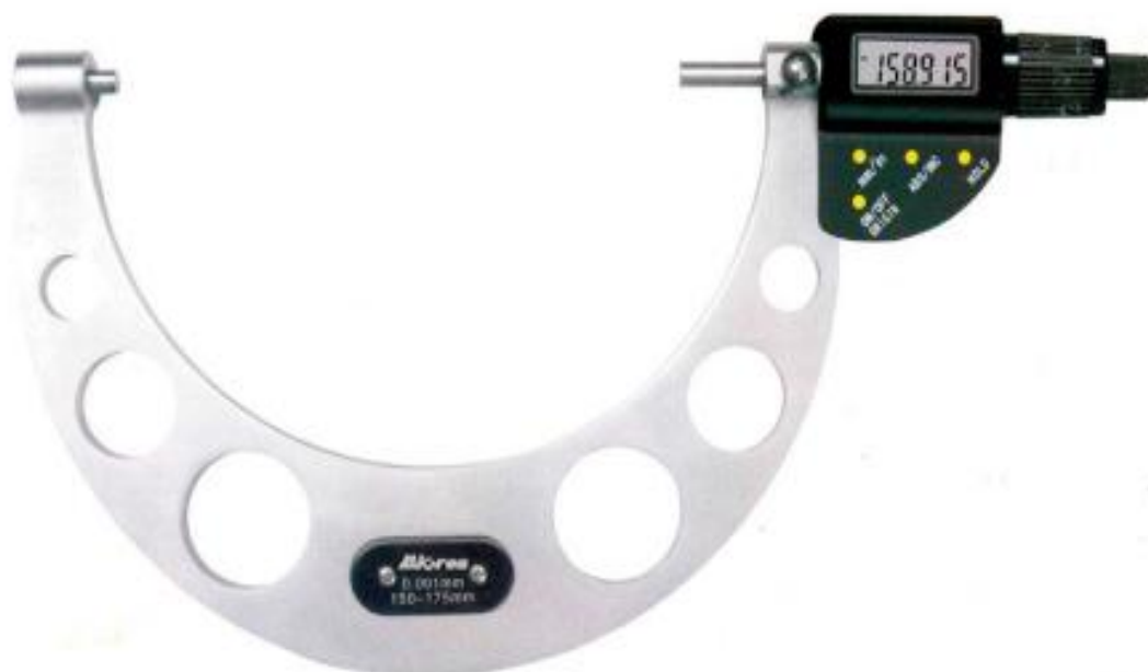
Рисунок 11 – Общий вид исполнения микрометров модели МКЦ