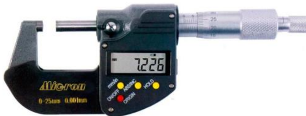
Рисунок 7 – Общий вид исполнения микрометров модели МКЦ