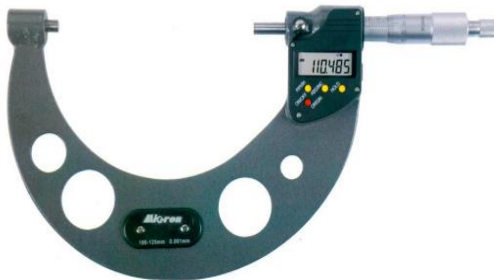
Рисунок 12 – Общий вид исполнения микрометров модели МКЦ