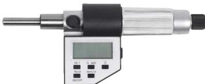
Рисунок 17 – Общий вид микрометров модели МГЦ

Пломбирование корпуса микрометров от несанкционированного доступа не предусмотрено.