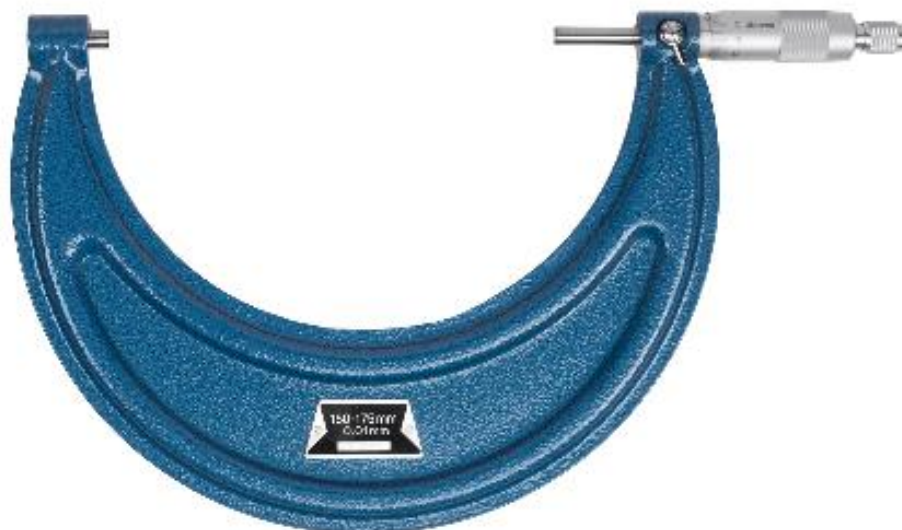
Рисунок 4 – Общий вид исполнения микрометров модели МК