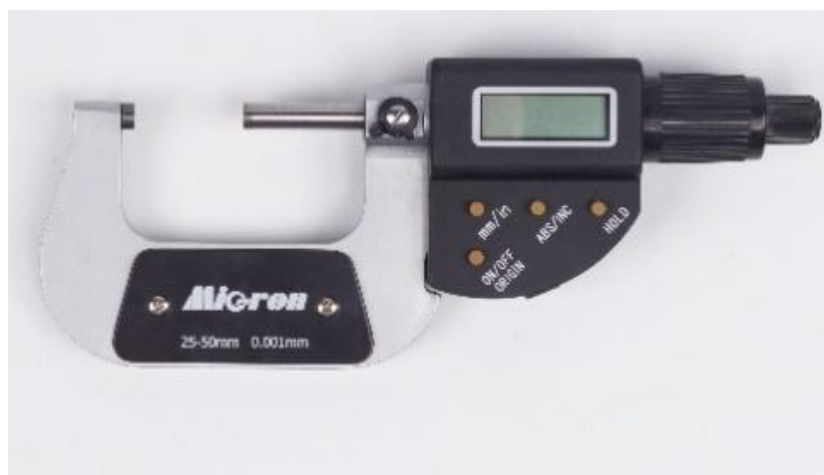
Рисунок 6 – Общий вид исполнения микрометров модели МКЦ