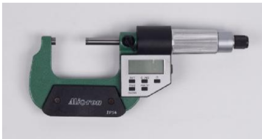
Рисунок 8 – Общий вид исполнения микрометров модели МКЦ