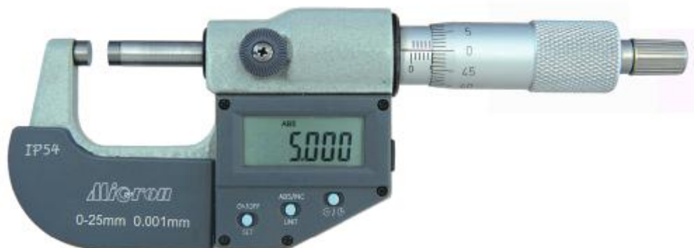
Рисунок 9 – Общий вид исполнения микрометров модели МКЦ