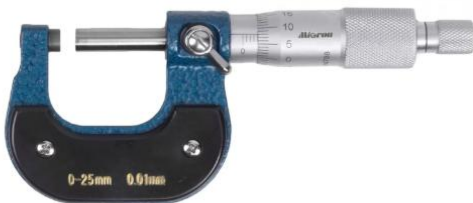
Рисунок 2 – Общий вид исполнения микрометров модели МК