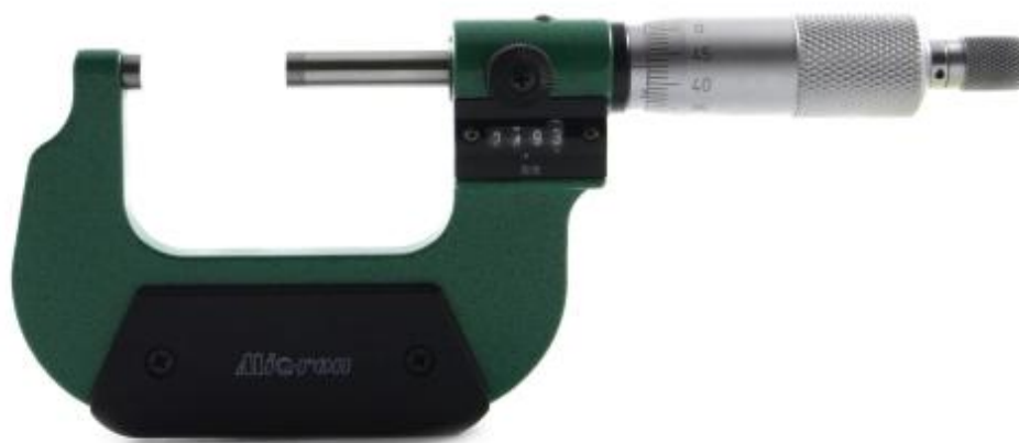
Рисунок 14 – Общий вид микрометров модели МКЦМ