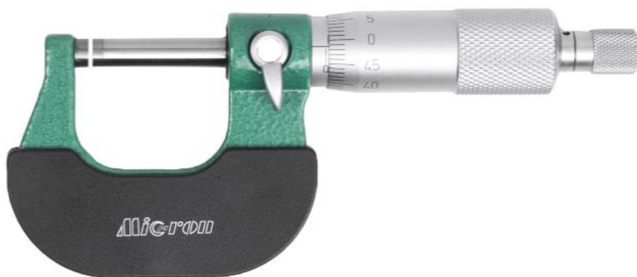
Рисунок 1 – Общий вид исполнения микрометров модели МК