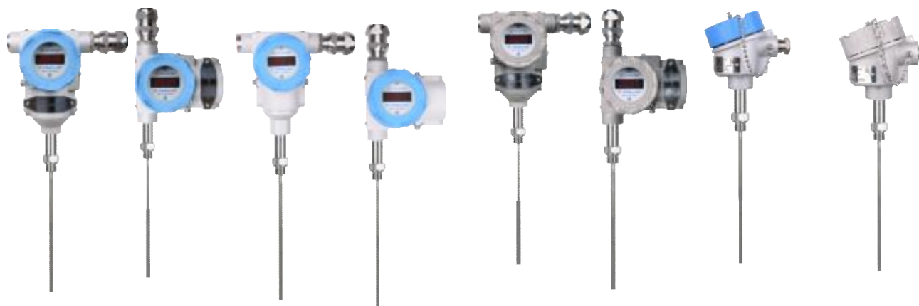
Рисунок 1 – Общий вид термопреобразователей прецизионных ПТ 0304-ВТ с наружной резьбой штуцера

Схема пломбировки термопреобразователей от несанкционированного доступа представлена на рисунке 7.