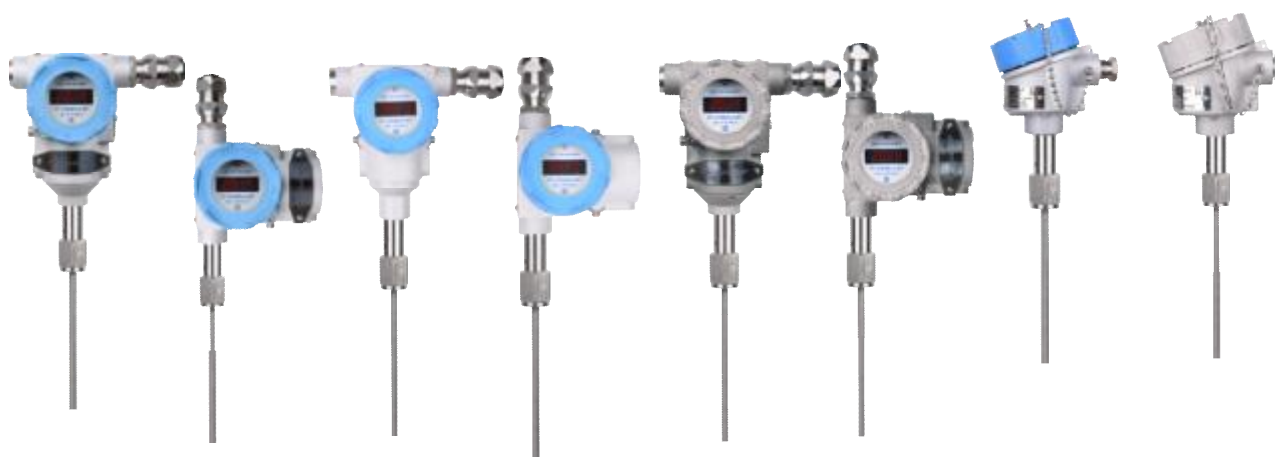
Рисунок 2 – Общий вид термопреобразователей прецизионных ПТ 0304-ВТ с внутренней резьбой штуцера