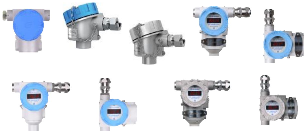
Рисунок 6 – Общий вид измерительных преобразователей ИП