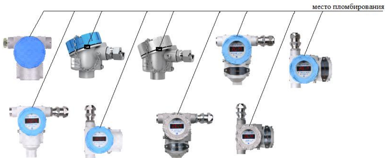
Рисунок 7 – Схема пломбировки от несанкционированного доступа