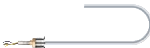
Рисунок 5 – Общий вид ПП из гибкого кабеля в стальной оболочке