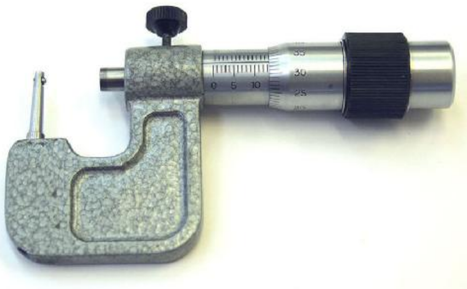
Рисунок 1 – Общий вид микрометра трубного МТ 15-М

Общий вид средства измерений представлен на рисунке 1.