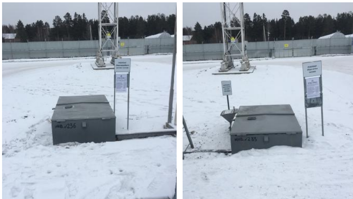
Рисунок 1 – Общий вид видимой части конструкции резервуаров горизонтальных стальных РГСД-75

Общий вид видимой части конструкции и эскизы резервуаров горизонтальных стальных РГСД-75 представлен на рисунке 1-2.