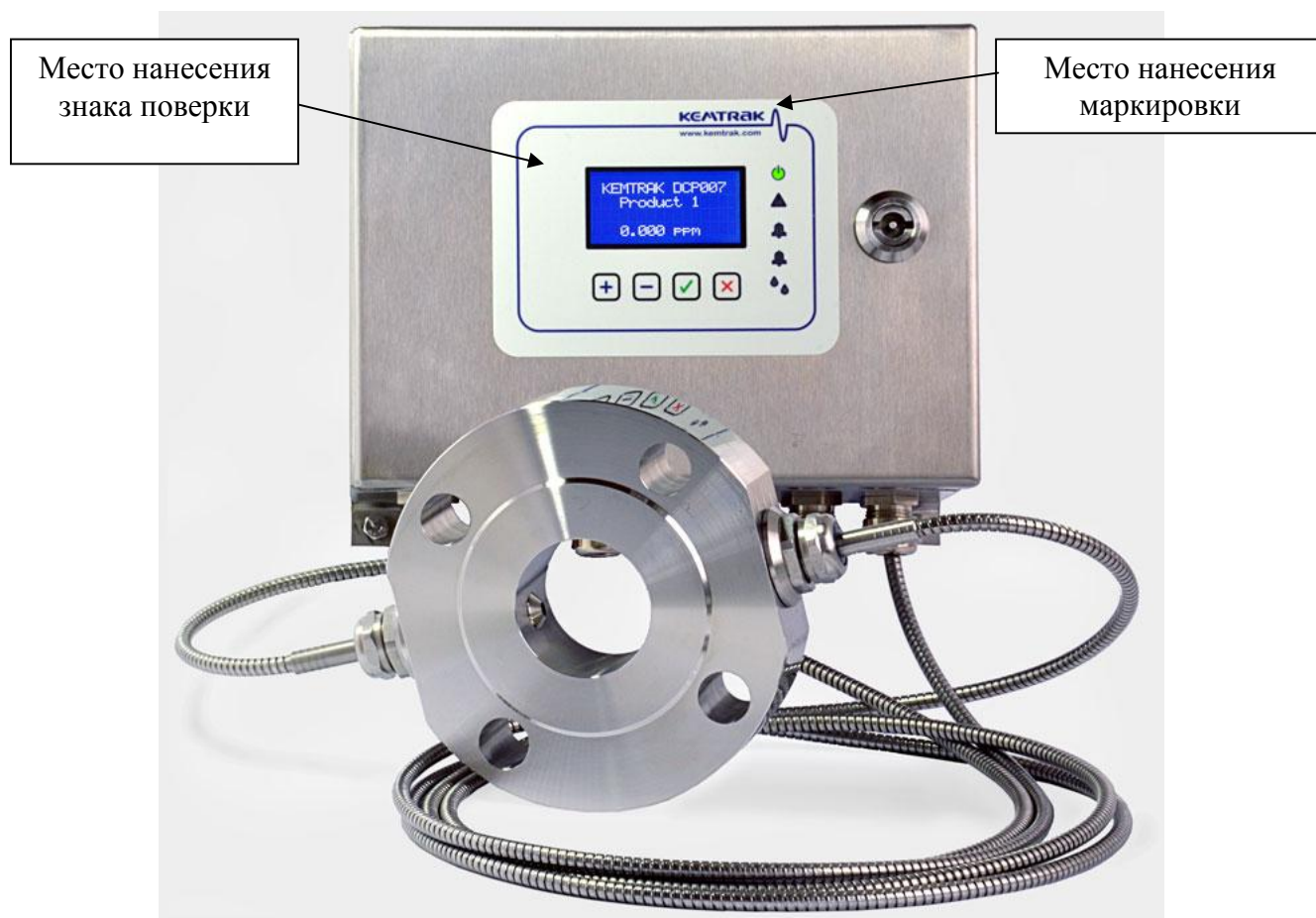
Рисунок 1 - Общий вид анализаторов технологических процессов серии Kemtrak 007