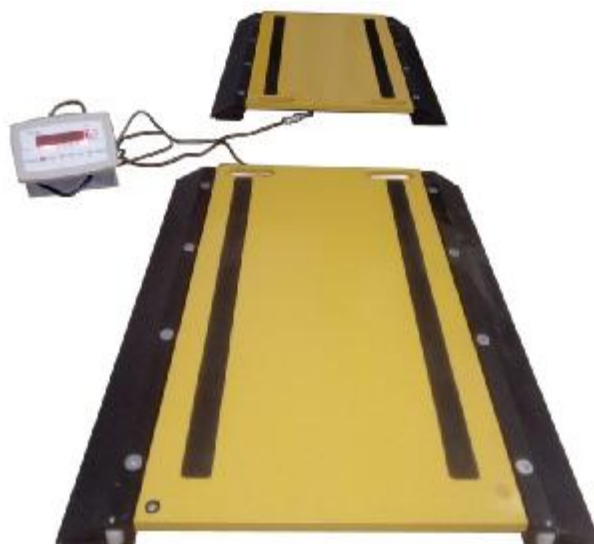
Рисунок 1 — Общий вид весов (пример)