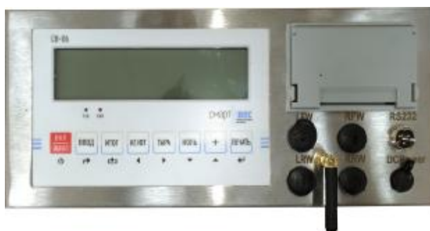
Рисунок 3 — Внешний вид весоизмерительного прибора СВ-06

Пломбировка корпуса с помощью разрушаемой наклейки