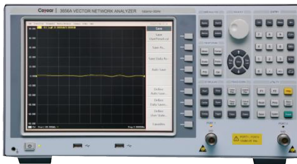
Рисунок 1 – Общий вид анализаторов. Вид спереди

Схема пломбировки от несанкционированного доступа представлена на рисунке 2.