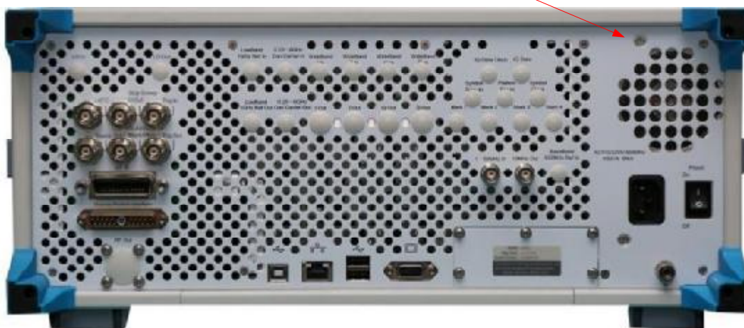
б) Вид сзади