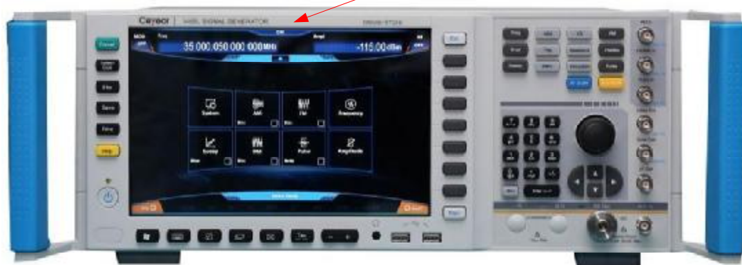
а) Вид спереди