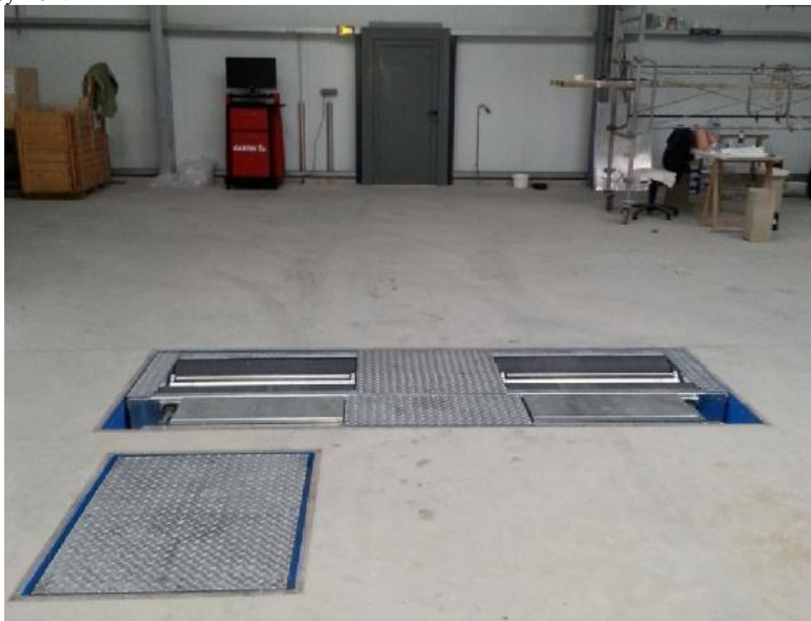
Рисунок 1 – Общий вид комплексов с приборной стойкой

Общий вид стендов приведён на рисунке 1. Пример заводской таблички приведён на рисунке 2.