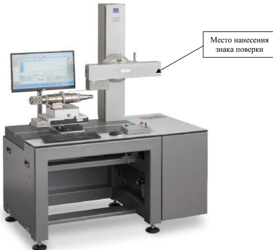
Рисунок 3 – Общий вид приборов для измерений параметров контура и шероховатости поверхности Waveline W900 и место нанесения знака поверки