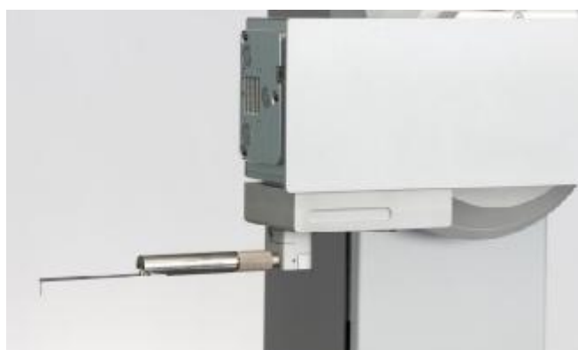
Рисунок 4 – Общий вид датчиков для измерений параметров шероховатости поверхности TKU400