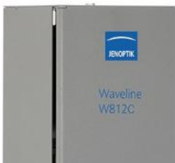
Рисунок 1 – Пример обозначения модификации

Модификации приборов различаются визуально, а также метрологическими и техническими характеристиками.