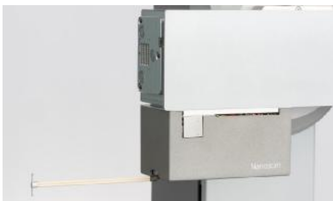
Рисунок 7 – Общий вид датчиков для измерений параметров шероховатости и контура поверхности Nanoscan