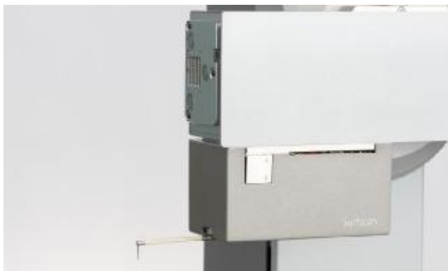
Рисунок 6 – Общий вид датчиков для измерений параметров контура и шероховатости Surfscan