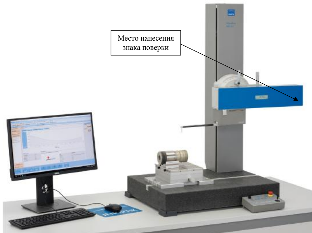
Рисунок 2 – Общий вид приборов для измерений параметров контура и шероховатости поверхности Waveline W800 и место нанесения знака поверки

Пломбировка приборов от несанкционированного доступа не предусмотрена.