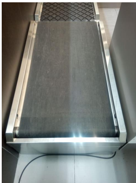
Рисунок 1 – Общий вид ГПУ весов