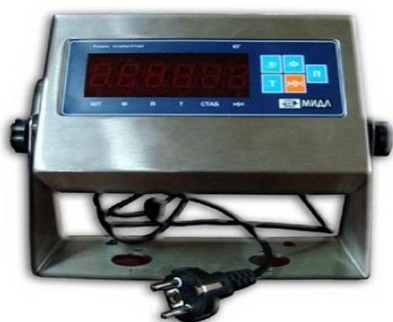
МИ ВДА (ВЖА)/12Я