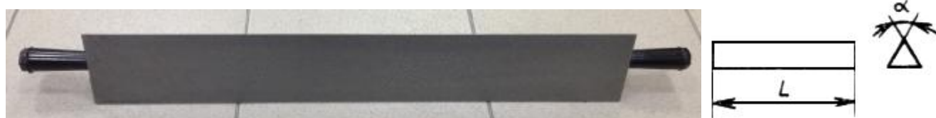
Рисунок 4 – Общий вид линеек УТ, обозначение основных размеров поверхностей