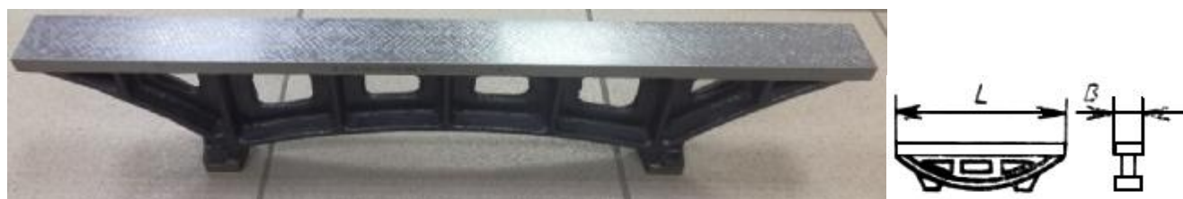
Рисунок 2 – Общий вид линеек ШМ, обозначение основных размеров