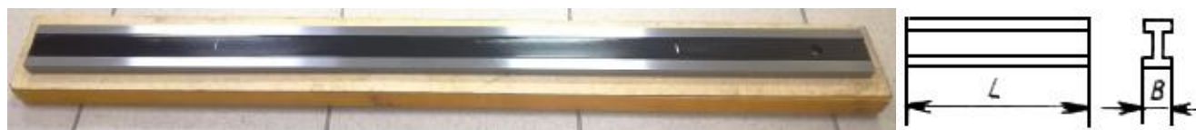
Рисунок 1 – Общий вид линеек ШД, обозначение основных размеров