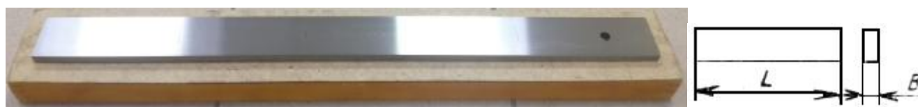
Рисунок 3 – Общий вид линеек ШП, обозначение основных размеров