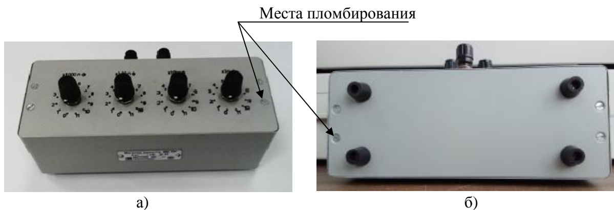
Рисунок 1 – Общий вид магазинов емкости