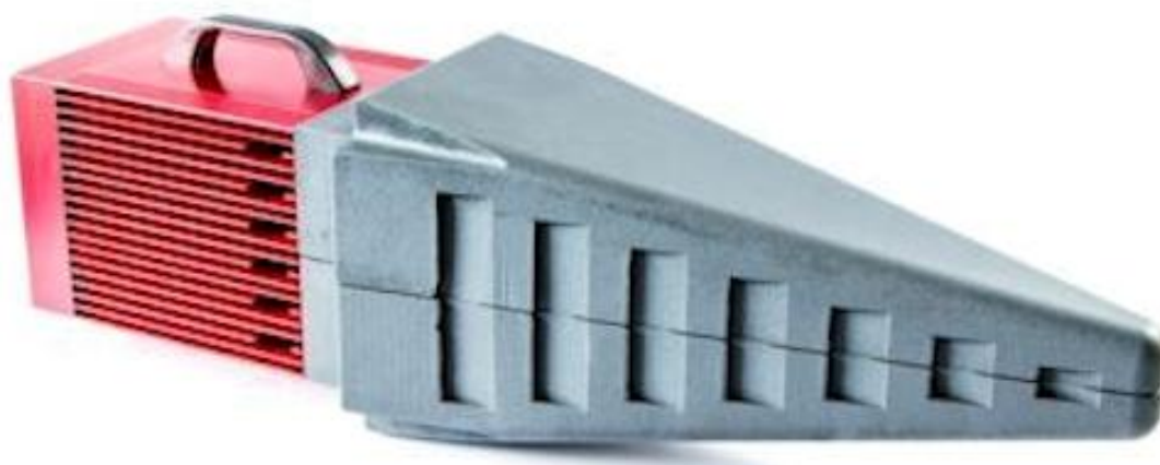
Рисунок 3 – Общий вид генераторов поля модификаций RFS2006AR, RFS2003BR, RFS2006BR