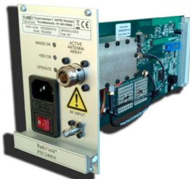
Рисунок 5 – Общий вид модуля RadiField PSU2400A