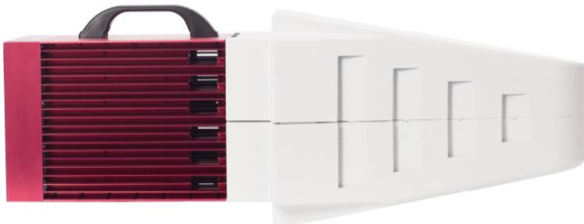
Рисунок 4 – Общий вид генераторов поля модификации RFS2018BR