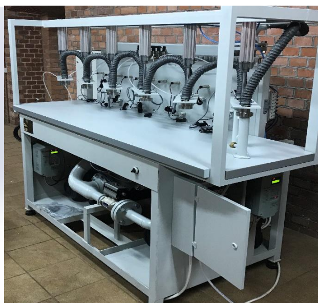
Рисунок 2 – общий вид установок модификации С