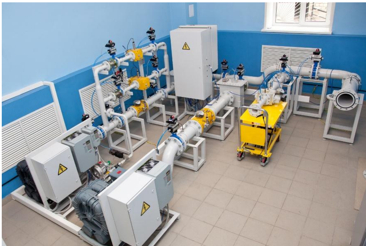
Рисунок 3 – общий вид установок модификации М