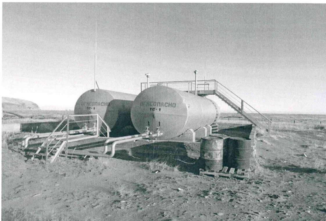
Рисунок 1 – Общий вид резервуара РГС-50

Общий вид резервуаров горизонтальных стальных цилиндрических РГС-50 заводской № 5, РГС-60 заводские №№ 1, 2, 3, 4, 6 представлен на рисунках 1-2.