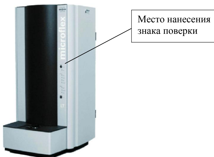
Рисунок 1 - Общий вид масс-спектрометра microflex LT/SH

Общий вид масс-спектрометров и место нанесения знака поверки приведены на рисунках 1 - 5.