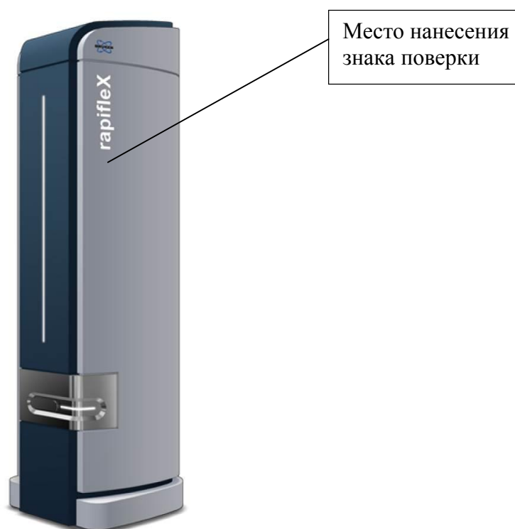
Рисунок 5- Общий вид масс-спектрометров rapifleX MALDI TOF MS, rapifleX MALDI TOF/TOF