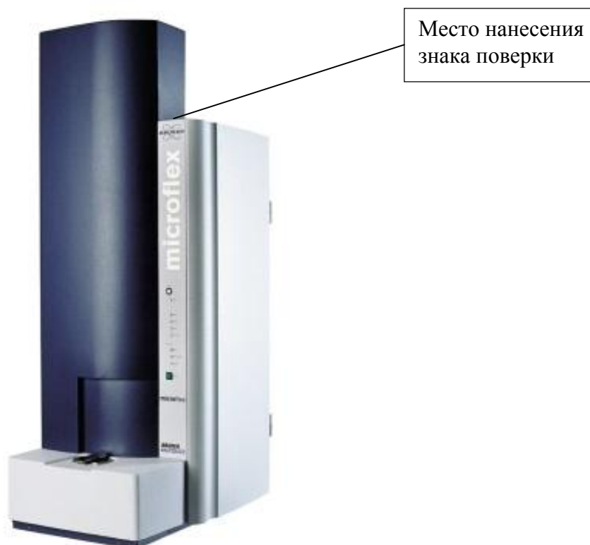
Рисунок 2 - Общий вид масс-спектрометров microflex LRF