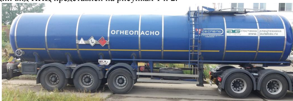
Рисунок 1 – Общий вид ППЦ 96487Р зав. №X8A96487PD0000027

Общий вид ППЦ представлен на рисунках 1 и 2.