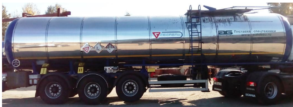
Рисунок 2 – Общий вид ППЦ 96487Р зав. №X8A96487PD0000015 и ППЦ 96487С зав. №№X8A96487CE0000028, X8A96487CE0000029