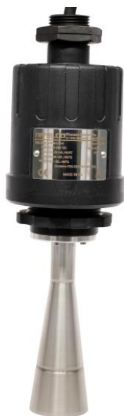
г) Уровнемер с рупорной антенной и резьбовым присоединением