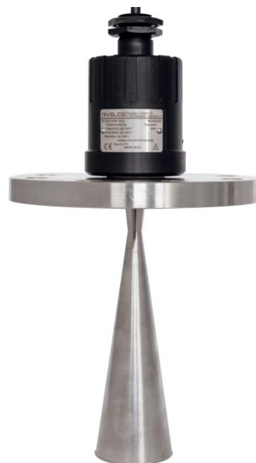
д) Уровнемер с рупорной антенной и фланцевым присоединением