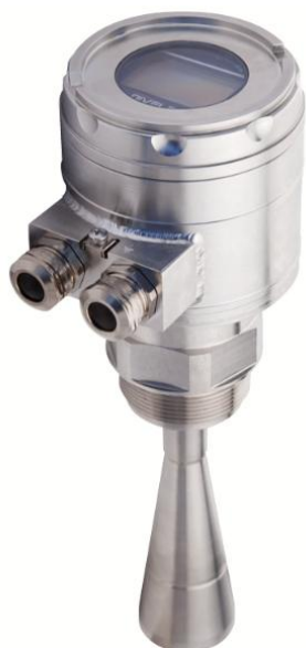
а) Уровнемер с рупорной антенной

Общий вид средства измерений представлен на рисунке 1. Пломбирование уровнемеров не предусмотрено.