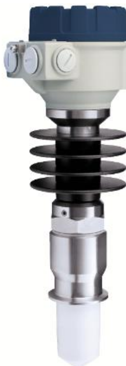
в) Уровнемер с антенной и технологическим уплотнением