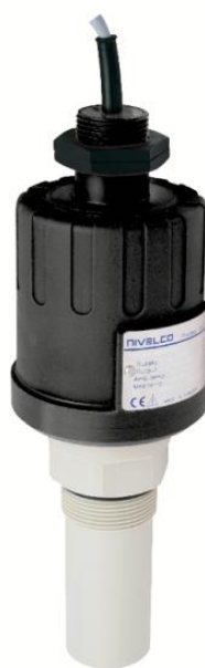
е) Уровнемер с антенной и с пластиковым технологическим уплотнением