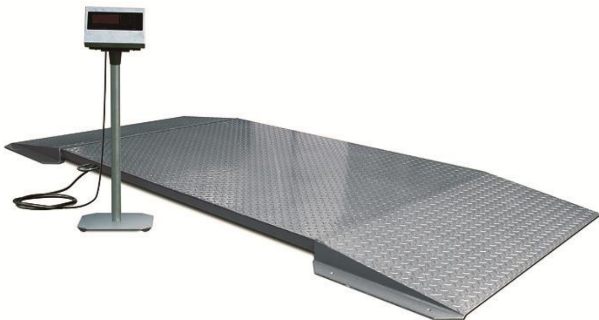
Рисунок 1 – Общий вид ГПУ модификации ПВ

Схема пломбировки от несанкционированного доступа и обозначение мест нанесения знака поверки представлены на рисунках 3, 4.