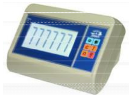
МИ ВДА (ВЖА)/7Я