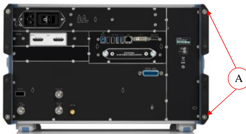
Рисунок 2 - Схема пломбировки от несанкционированного доступа (А)