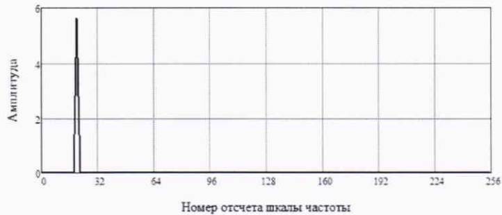
Рисунок 3 – Пример обработки измеренного сигнала в частотной области

8.3.1.8 В полученном частотном спектре (рисунок 3) выделить спектральную составляющую максимального уровня, определить соответствующую ей частоту по формуле (8.3.1.1):