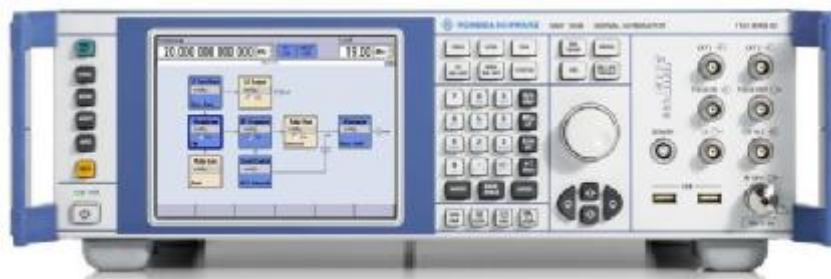
Рисунок 8 – Общий вид генератора сигналов SMF100A