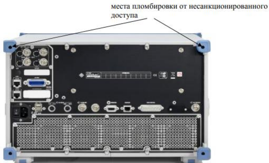
Рисунок 2 – Задняя панель векторного анализатора цепей ZVA40