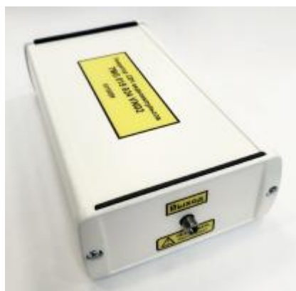
Рисунок 3 – Общий вид генератора TMG015024VN02