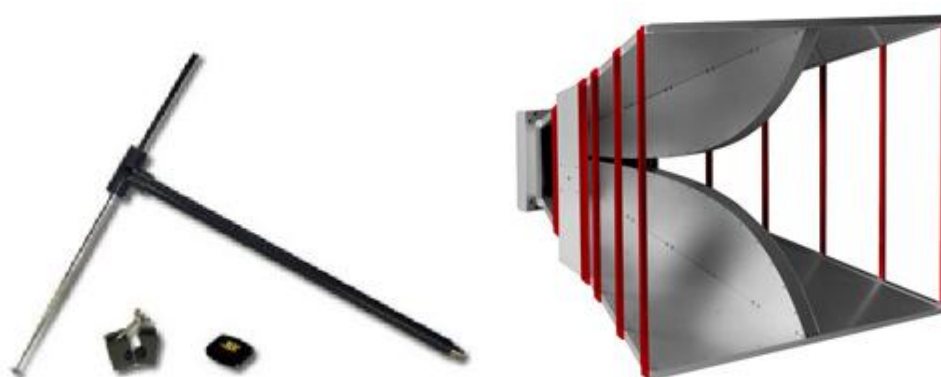
Рисунок 4 – Общий вид антенны FCC-2 из комплекта измерительных антенн А.Н. Systems TDS-535 (антенна 1, слева) и ETS-Lindgren EMCO 3106 (антенна 2, справа)