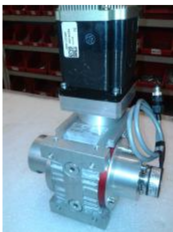
Рисунок 7 – Общий вид автоматизированного вспомогательного механизма вращения