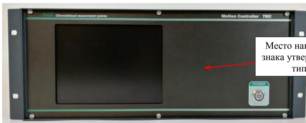
Рисунок 10 – Общий вид контроллера перемещения TMC 3112