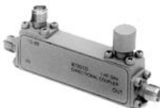
Рисунок 9 – Общий вид направленного ответвителя Agilent 87301