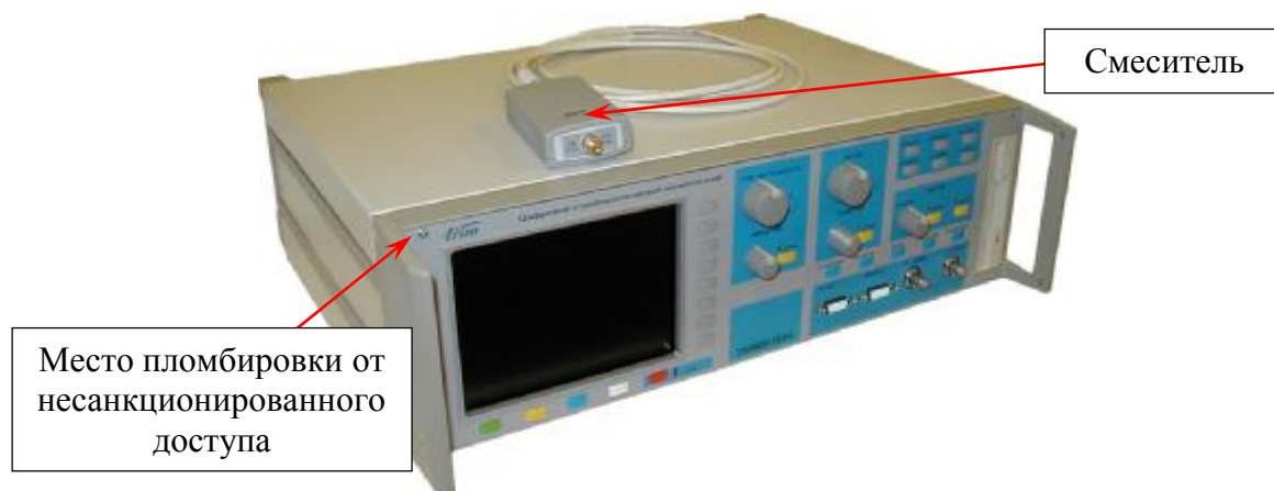
Рисунок 1 – Общий вид сверхширокополосного приемного устройства TMR 8140 с внешним смесителем

Схема пломбировки от несанкционированного доступа представлена на рисунках 1 и 2. Обозначение места нанесения знака утверждения типа представлено на рисунке 10.