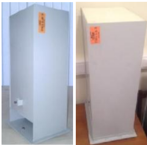
Рисунок 5 – Общий вид измерительной антенны ТМА 03-18Э (антенна 3, слева) и ТМА 18-40Э (антенна 4, справа)