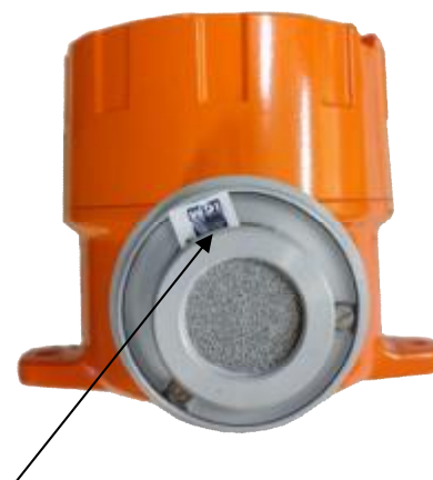
Место нанесения пломбы