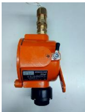
Рисунок 4 – Общий вид газоанализаторов ИГМ-10ИК и ИГМ-10Э