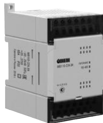
Рисунок 3 - Модуль аналогового ввода МВ 110