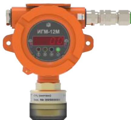
Рисунок 6 – Общий вид газоанализатора ИГМ-12М