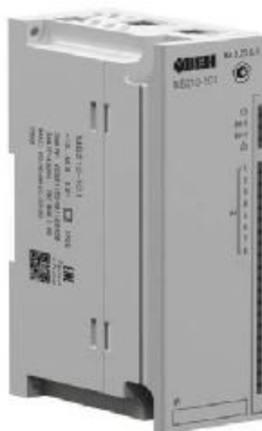
Рисунок 2 - Модуль аналогового ввода МВ 210