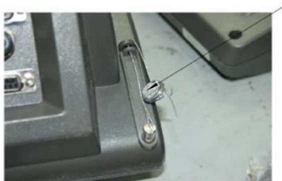
МИ ВДА (ВЖА)/12Я и МИ ВДА (ВЖА)/7Я