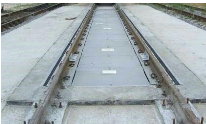
Рисунок 1 - Общий вид ГПУ весов модификаций ВВ-СДТ

Схема пломбировки от несанкционированного доступа и обозначение мест нанесения знака поверки представлены на рисунке 4.