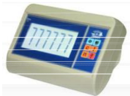
МИ ВДА (ВЖА)/7Я