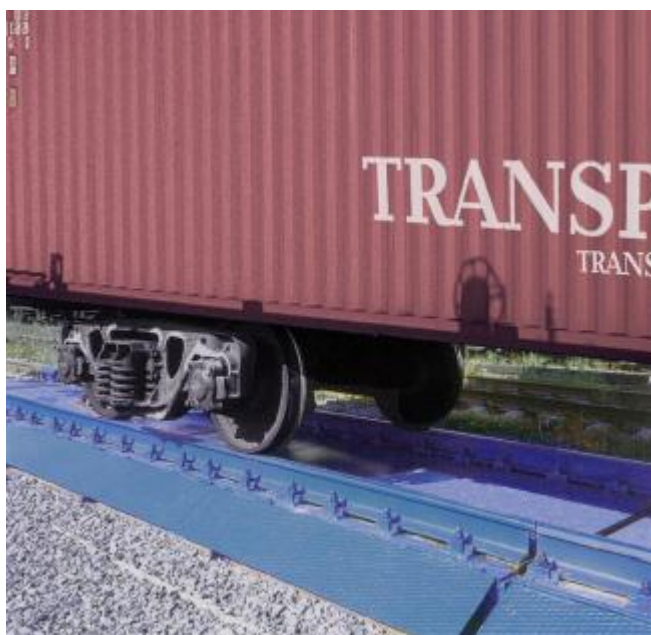
Рисунок 2 - Общий вид ГПУ весов модификаций ВВ-ДТ