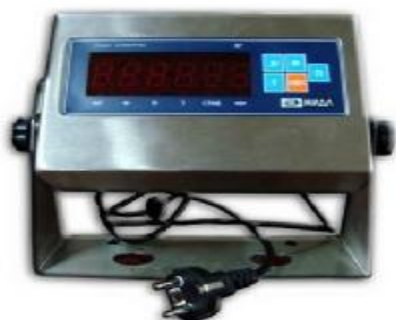
МИ ВДА (ВЖА)/12Я