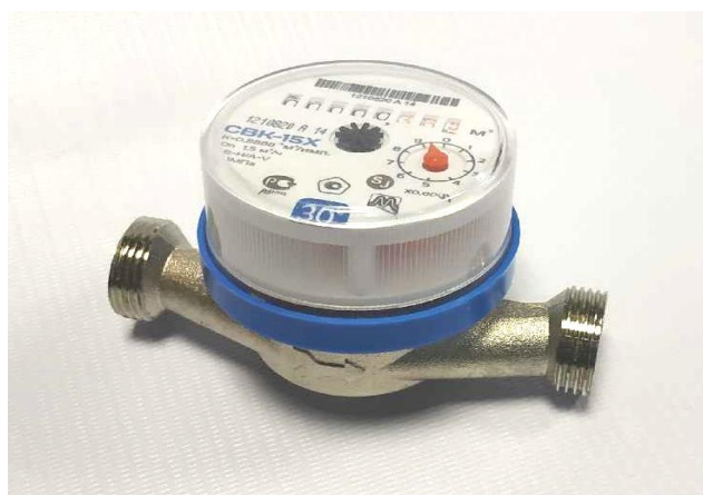
Рисунок 1 – Общий вид счетчиков СВК DN 15

Общий вид счетчиков и схема пломбировки представлена на рисунках 1 - 5.