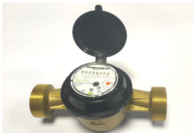
Рисунок 2 – Общий вид счетчиков СВК DN 20 – 50