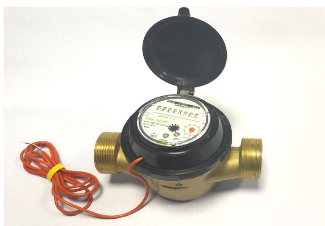
Рисунок 3 – Общий вид счетчиков СВК DN 20 – 50 с импульсным выходом