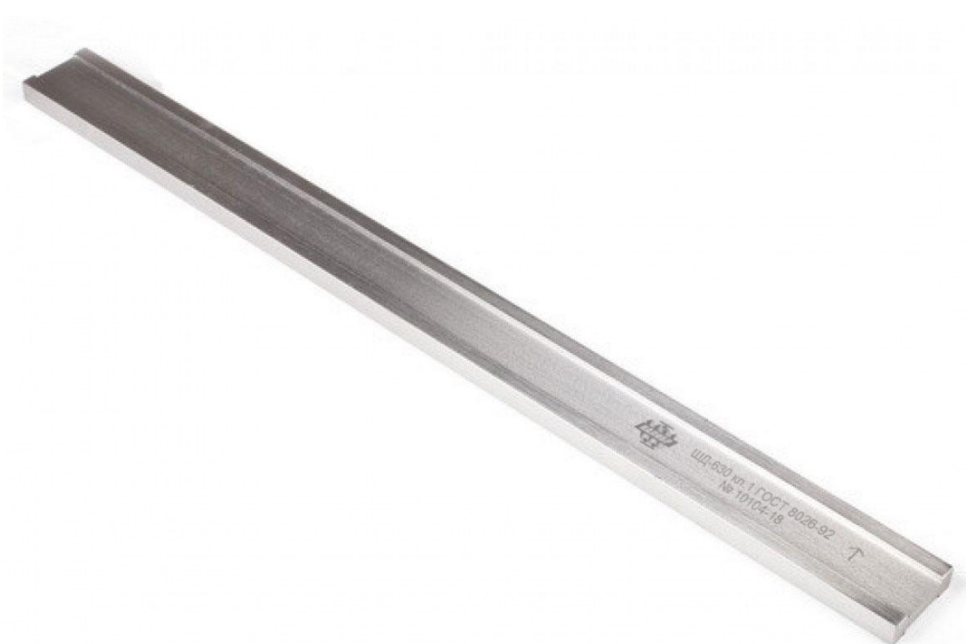
Рисунок 5 – Общий вид линейек типа ШД