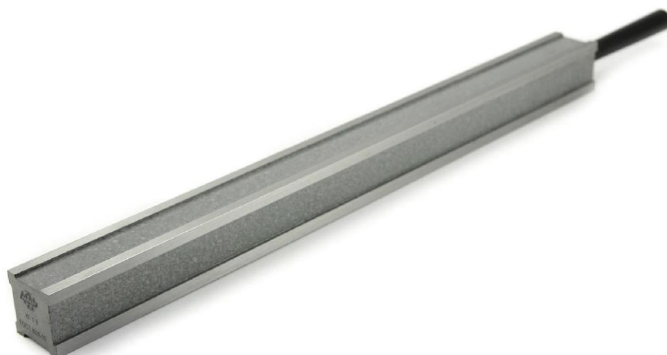
Рисунок 3 – Общий вид линейек типа ЛЧ