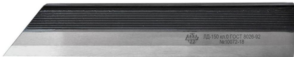
Рисунок 1 – Общий вид линеек типа ЛД

Общий вид линеек указан на рисунках 1-7.