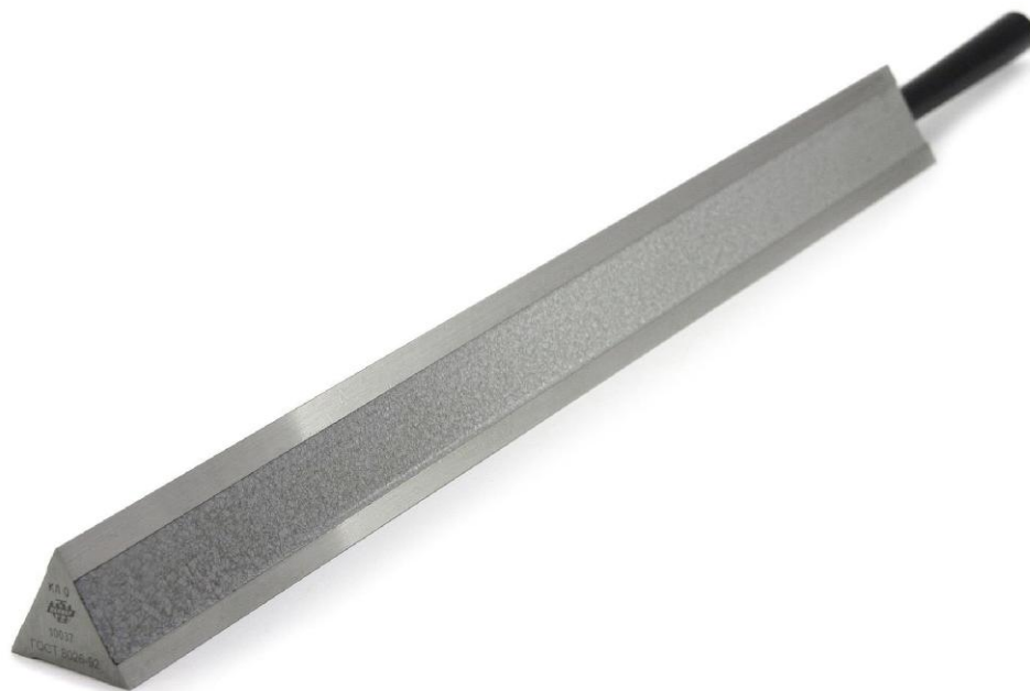
Рисунок 2 – Общий вид линейек типа ЛТ