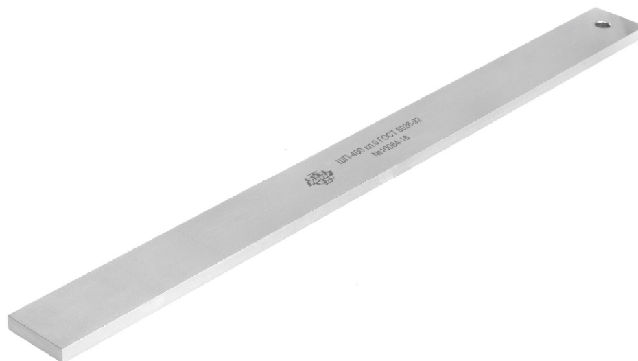
Рисунок 4 – Общий вид линейек типа ШП