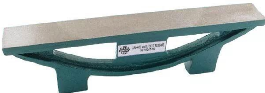
Рисунок 6 – Общий вид линейек типа ШМ