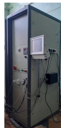
б) блок управления приводом, пульт оператора