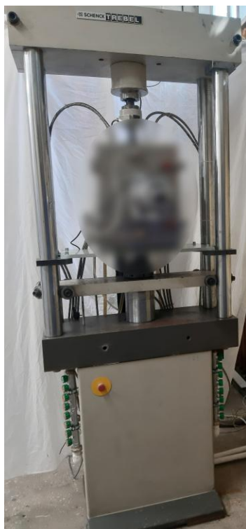
а) модуль силозадающий