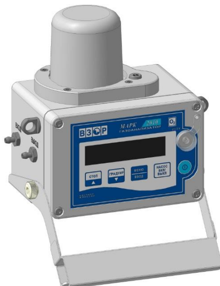
Рисунок 1 – Общий вид газоанализатора

Схема пломбирования от несанкционированного доступа к элементам конструкции, обозначение места нанесения знака поверки представлены на рисунке 2.