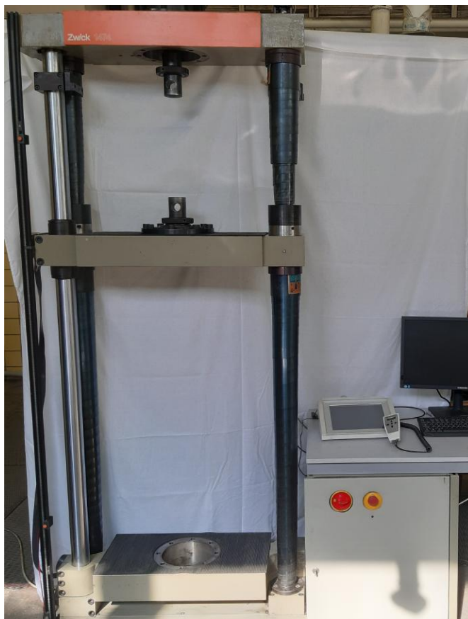
Рисунок 1 – Общий вид машины универсальной испытательной ZWICK 1474-М

Для предотвращения несанкционированного доступа производится опломбирование пульта оператора машины наклейками. Схема пломбировки от несанкционированного доступа пульта оператора представлена на рисунке 2.