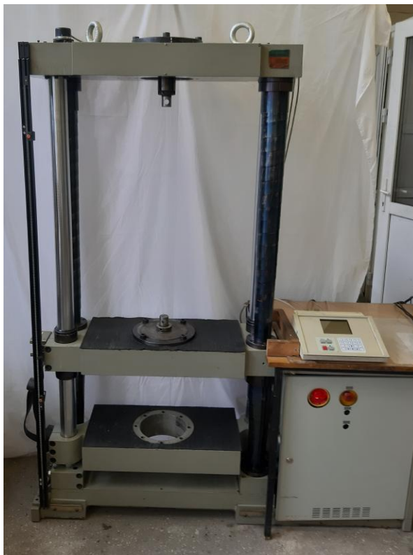
Рисунок 1 – Общий вид машины универсальной испытательной ZWICK 1464-M

Для предотвращения несанкционированного доступа производится опломбирование пульта оператора машины наклейками. Схема пломбировки от несанкционированного доступа пульта оператора представлена на рисунке 2.