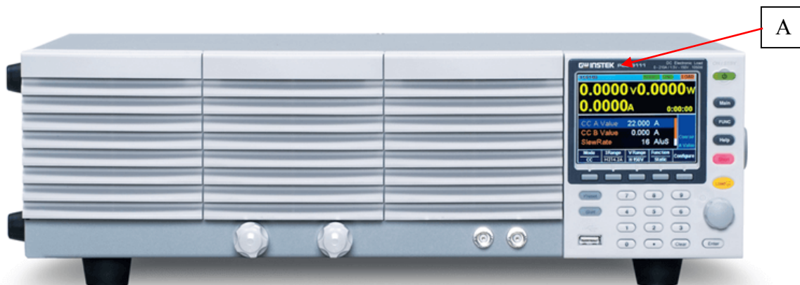
Рисунок 3 – Общий вид нагрузок модификаций PEL-73211 и PEL-73211H и схема нанесения знака утверждения типа (А)