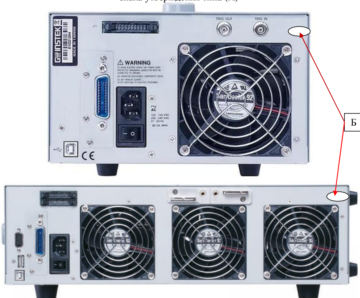
Рисунок 5 – Схема пломбировки от несанкционированного доступа (Б)