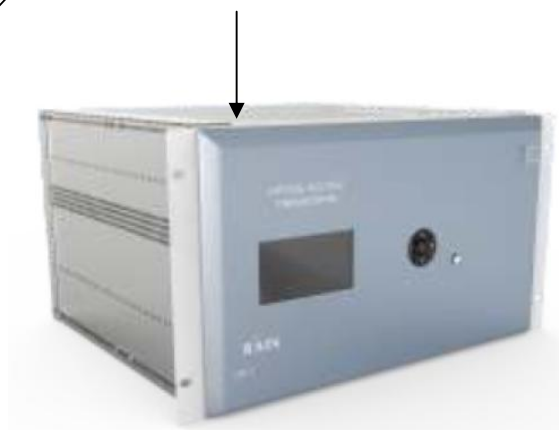
Рисунок 2 – Электронно-оптический блок цифровой обработки (БЦО)

Место пломбировки от несанкционированного доступа