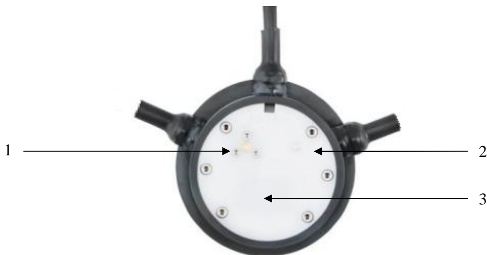
Рисунок 1 – Общий вид преобразователей IRS31Pro-UMB 1 – преобразователь концентрации солей, 2 – термометр сопротивления, 3 – излучатель и приемник инфракрасного излучения