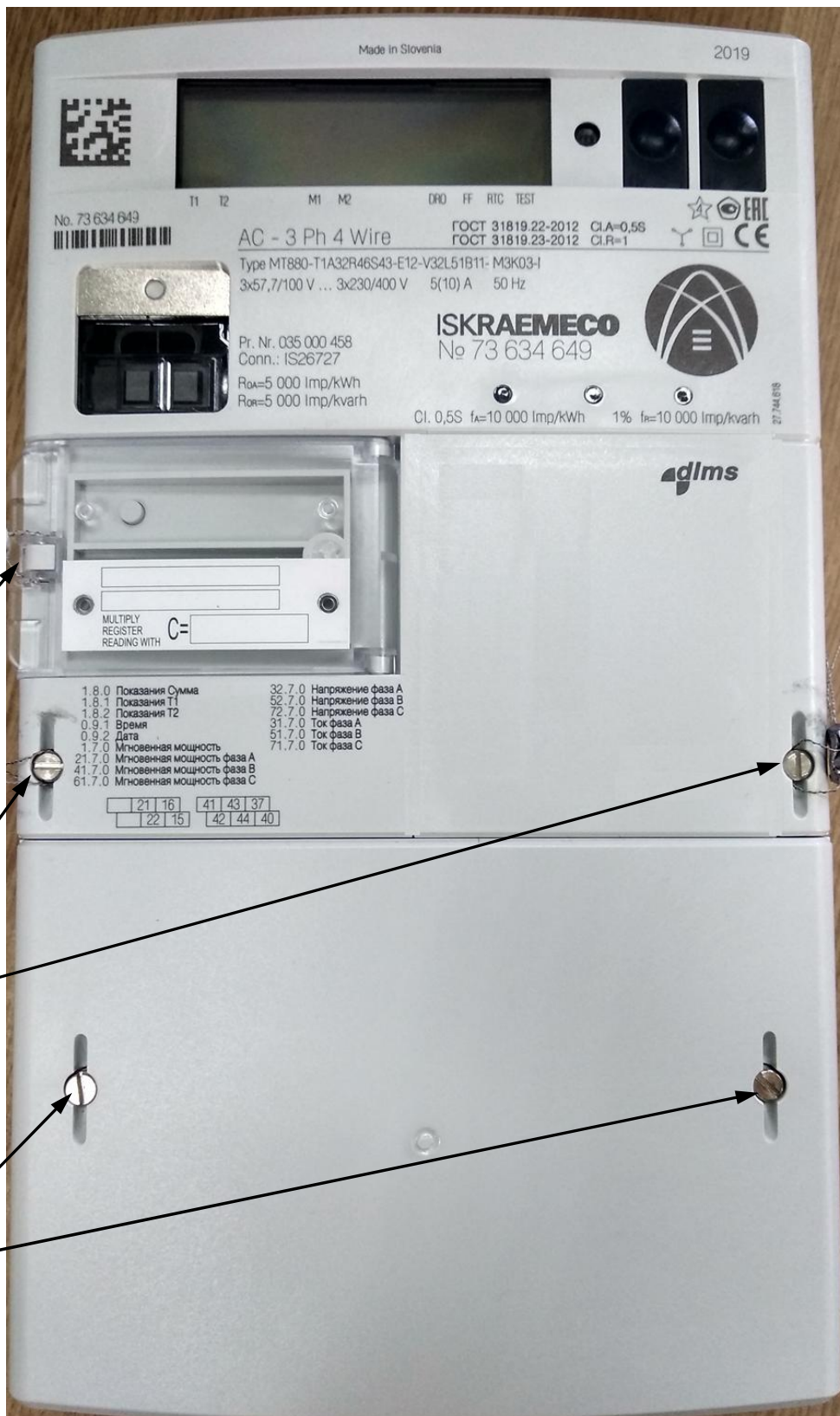
Рисунок 1 – счетчик статический трехфазный переменного тока активной и реактивной энергии MT880 исполнений MT880-...-I