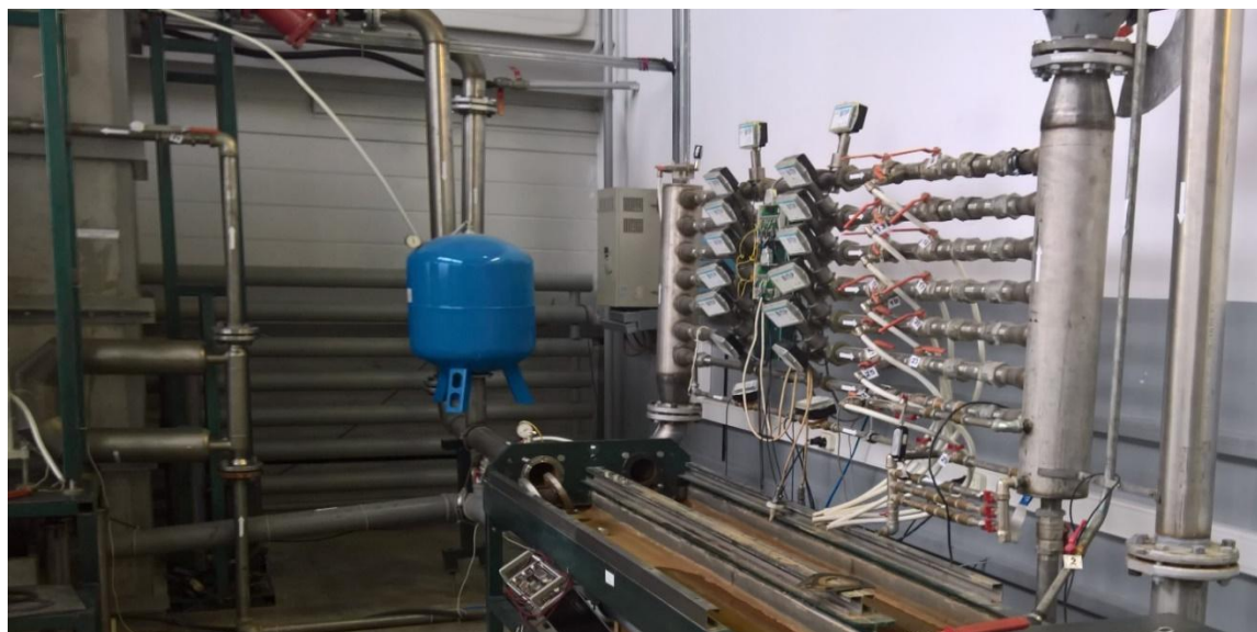
Рисунок 1 – Общий вид установки поверочной СПРУТ 100М

Поверяемое средство измерений устанавливается в измерительную линию установки, состоящий из зажимного устройства, запорной арматуры, средств измерений массового и объемного расхода жидкости, массы и объема жидкости в потоке, давления и температуры измеряемой среды. Рабочая жидкость подается насосом из накопительного резервуара в гидравлический тракт рабочего контура установки, проходит через измерительный участок и расходомеры установки. Далее, рабочая жидкость направляется обратно в накопительный резервуар. Измерительно-вычислительный комплекс управляет работой установки, в автоматическом режиме собирает, обрабатывает и сравнивает полученные показания поверяемых средств измерений и средств измерений установки.